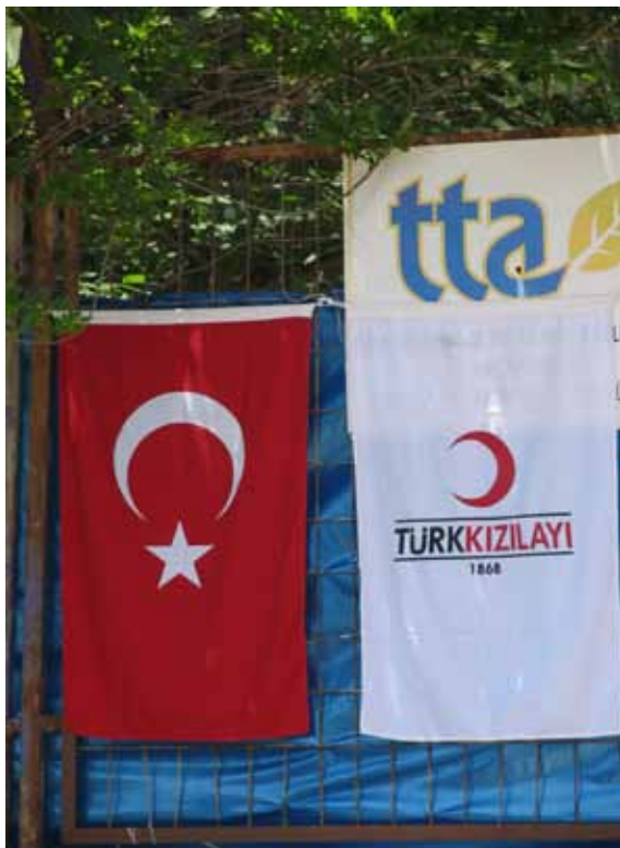
La barrière du camp de Yayladagi